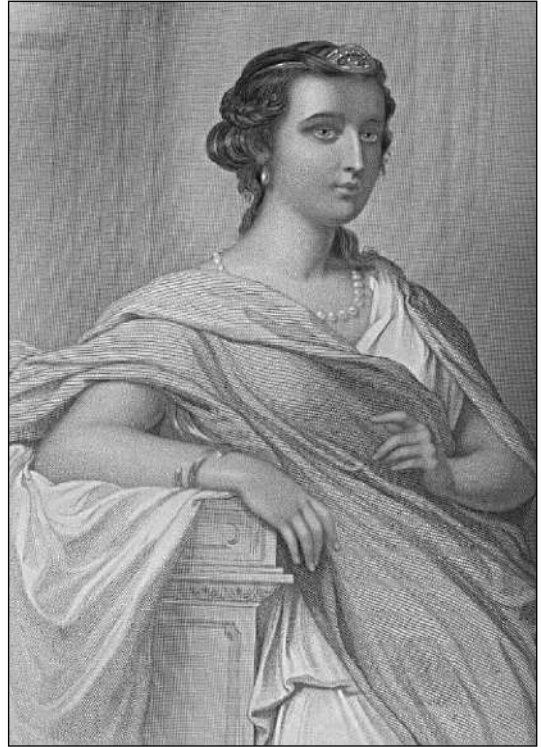
Aspasia de Mileto.

cípulo seu na arte da oratoria e que, coma el, sufriu un proceso por impiedade durante o cal Pericles (segundo Antístenes) derramou moitas lágrimas, sendo finalmente absolta. A súa fama de hetaira ou cortesá pode que se deba simplemente a que era unha estranxeira fóra do común, xa que non levaba a vida do resto das mulleres atenienses, recluídas no xineceo. Parece que estaba ao fronte dun negocio que os atenienses consideraban un bordel, pero que debía ser un escola de retórica ou un centro de educación para mozas. Pode que estas mozas acabasen sendo hetairas, pero non se pode dicir que todas as hetairas, polo feito de manter relacións sexuais máis libres, fosen prostitutas. As hetairas eran mulleres libres, non ligadas a ningún varón en particular, que tiñan formación intelectual e participaban nos simposia que celebraban os varóns como bailarinas, músicas, modelos ou acompañantes.