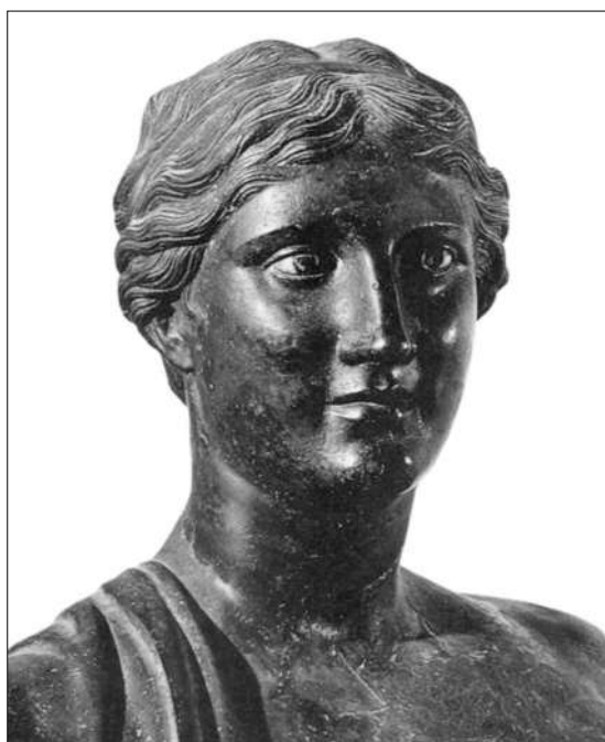
Suposto retrato da poeta Safo de Lesbos (s.Va.C.).

En canto á metodoloxía didáctica, asumimos os presupostos da Teoría da aprendizaxe significativa de Ausubel e Novak, contextualizada na psicoloxía cognitivo-construtiva de Piaget, é dicir, propomos un modelo educativo que potencie o proceso de ensino-aprendizaxe como un proceso de construción (ou reconstrución), que, mediante a integración dos novos contidos na estrutura cognoscitiva do alumnado, transforme progresivamente as súas capacidades cognoscitivo-interpretativas.