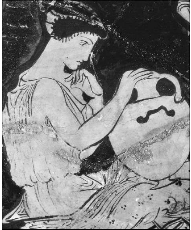
Na Grecia antiga o papel da muller era absolutamente secundario, non tiña ningún dereito e a súa actividade centrábase nos labores do fogar e coidado de fillas e fillos.

Zeus como castigo para os homes; da caixa que ela abriu saíron todas as dores e calamidades que se espallaron polo mundo. É dicir, a muller é a causa de todos os males. Este mito terá o seu paralelo no de Eva da tradición xudeocristiá como causante do pecado orixinal e do conseguinte castigo divino. Como veremos despois, Aristóteles, afirmaba que as mulleres son por natureza máis débiles e máis frías que os homes porque non están acabadas de facer, son varóns incompletos, de aí que avellentan antes, teñan a carne máis branda e o cerebro máis pequeno. Tamén para Aristóteles, a muller en canto nai non é máis que o soporte alimenticio e físico, a terra onde aniña o feto, sendo o pai o que deposita a semente xerminativa.