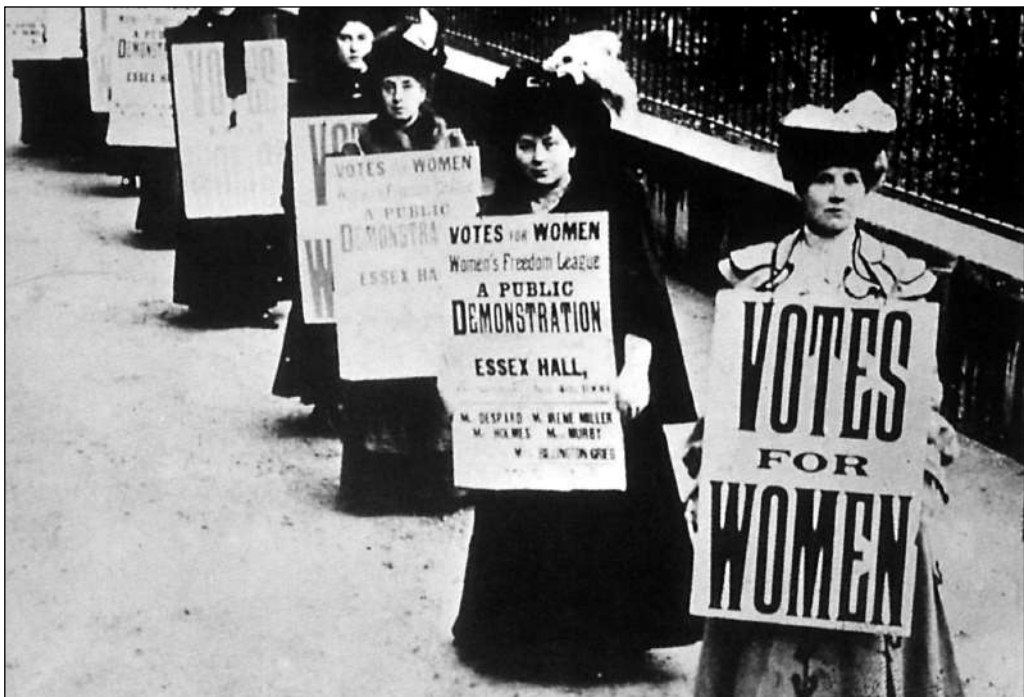
En 1860 o movemento das sufraxistas inglesas conseguiu mobilizar moitas mulleres para reclamar o dereito ao voto.