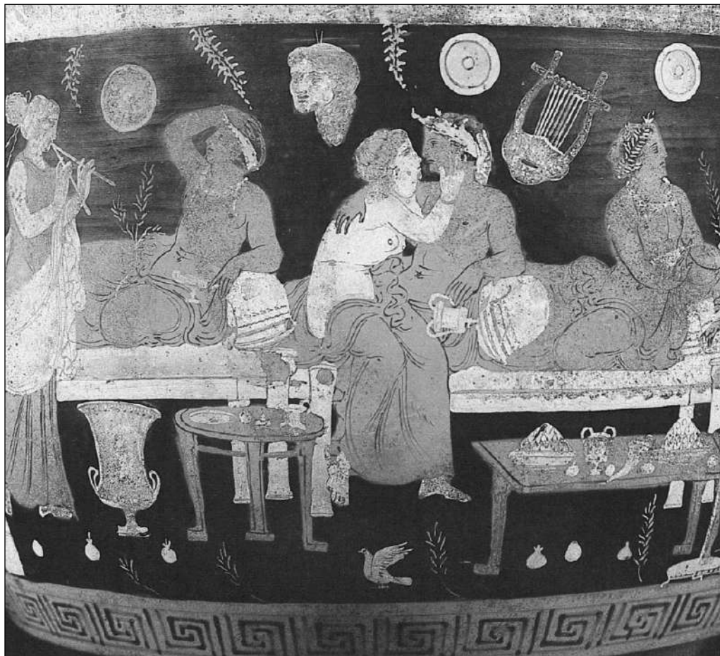
Detalle dun vaso ático no que aparecen Safo e Alceo (s.V a.C.).