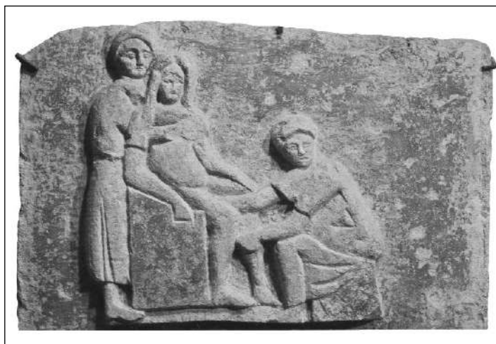
Sócrates, moi influído pola actividade da súa nai e polo pensamento das filósofas da súa época, compara o "oficio" de filósofo co oficio das parteiras. Estas –diactúan sobre o corpo das mulleres, eu sobre as almas dos homes.

Outras filósofas das que temos noticia son Areté , filla de Aristipo de Cirene, fundador da escola cirenaica, á que se lle atribúe a dirección da escola cando morreu o seu pai;