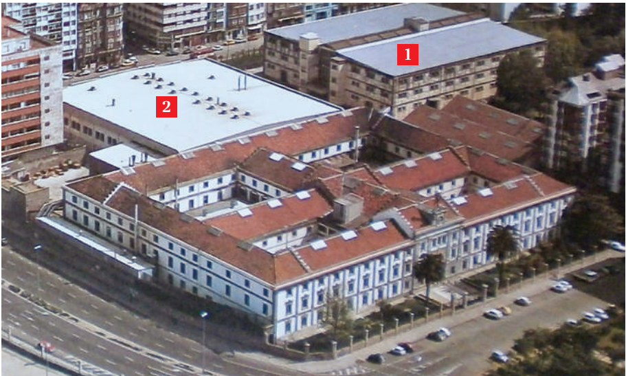
Conxunto da Fábrica de Tabacos e os almacéns de 1924 (1) e 1985 (2).

Pouco despois, o 1 de xullo de 1989, completábase a urbanización da zona da fábrica coa inauguración da praza da Palloza, presidida polo monumento ás cigarreiras, mentres a Coral Polifónica da Fábrica poñía música ao acto.