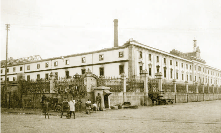
A fábrica despois do incendio de 1920.

Pouco despois, o 1 de xullo de 1989, completábase a urbanización da zona da fábrica coa inauguración da praza da Palloza, presidida polo monumento ás cigarreiras, mentres a Coral Polifónica da Fábrica poñía música ao acto.