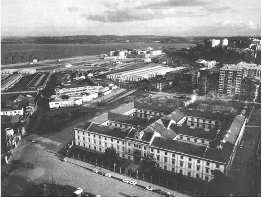
A Palloza en 1972.

O forte investimento de 1985 fixo da Palloza unha das fábricas de tabacos de maior produtividade de España conseguindo producir ata 13.000 cigarros por minuto que, en unión directa coa empaquetadora, procesaban 380 paquetes por minuto, introducidos en caixas de cartón e nos seus correspondentes caixóns para o envío fóra da fábrica.