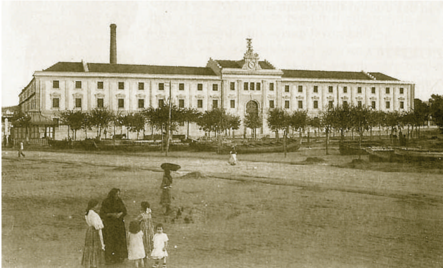
Vista da Palloza e da Fábrica de Tabacos c. 1910.

a Palloza adquire o aspecto exterior e interior que mantivo ata o seu peche en 2002 5 .